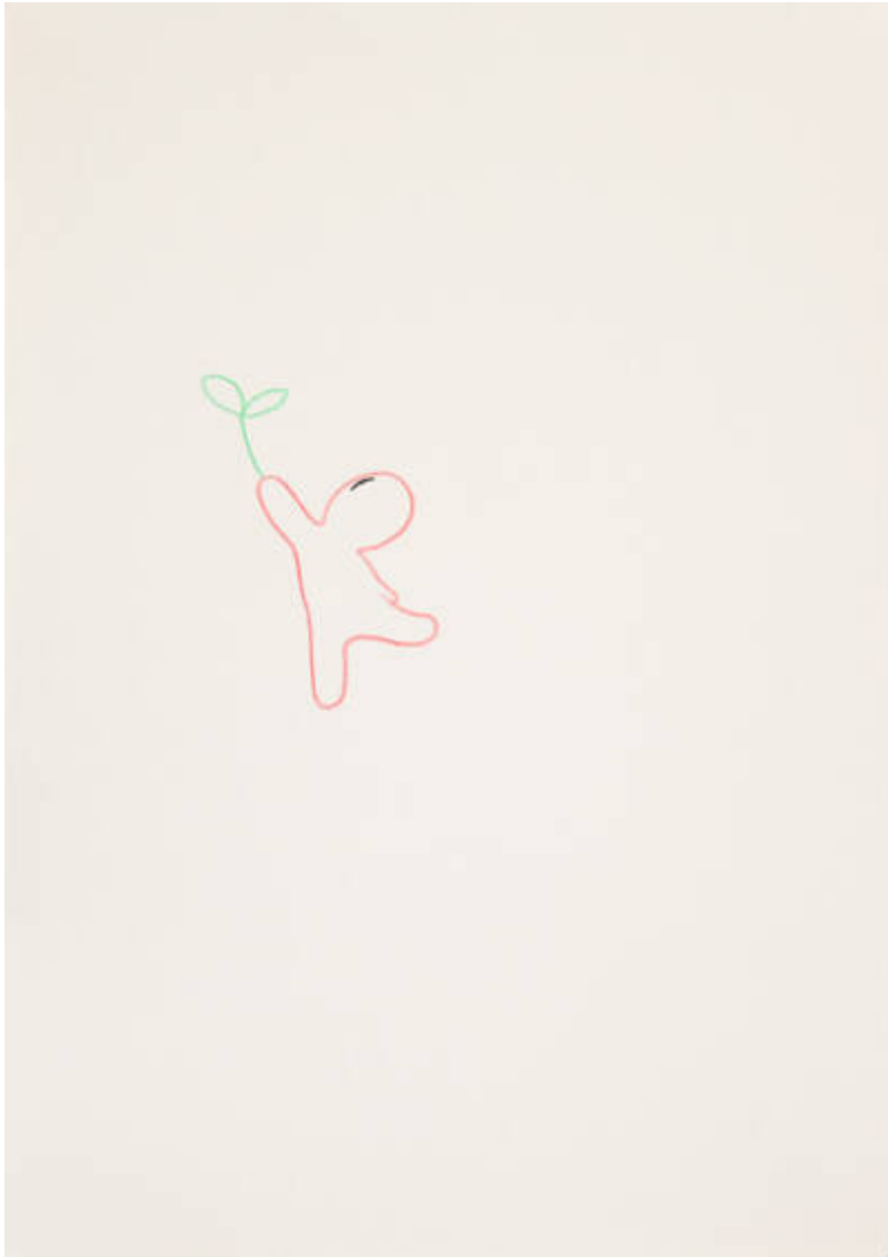
Im Osten des Westens (D-543-P-410)