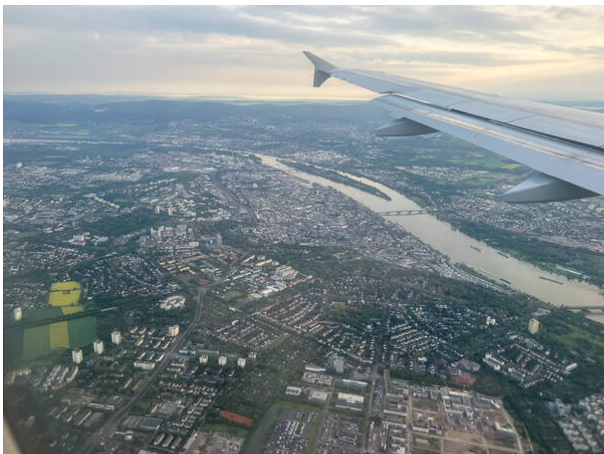
(Anflug über Mainz)

„Danke“ auf Armenisch wird in dieser Schrift so geschrieben: „ՇՆՈՐԻԿԱԿԱԼՈՒԹՅՈՒՆ“. Gesprochen: „Shnorhakat’yun“. Eine Kurzform davon gibt es nicht, da sagt man „Merci“.